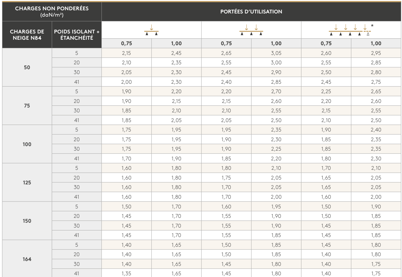
TABLEAU DES PORTÉES D'UTILISATION EN MÈTRES EN FONCTION DES CHARGES DESCENDANTES > épaisseurs nominales en mm

* : Les valeurs indiquées dans la colonne sont considérées valables en cas d'écarts entre portées adjacentes ne dépassant pas 20 %.